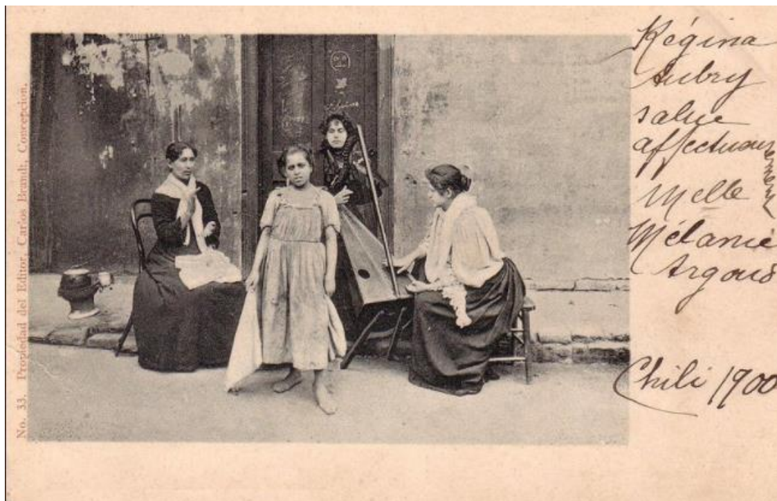
Figura 2: Postal publicada en sitio web Santiago Nostálgico.

digital, identificando una serie de postales publicadas en un sitio web que permitiría plantear una aproximación de data de registro fotográfico entre 1900 y 1910, para algunas de las imágenes seleccionadas.