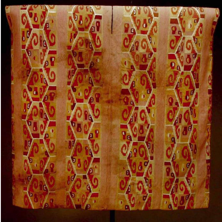
Figura 5: Camisa: Unku. Horizonte Wari-Tiwanaku .Museo Chileno de Arte Precolombino vii