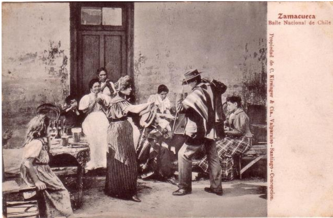
Figura 4: Postal publicada en sitio web Santiago Nostálgico.

https://www.flickr.com/photos/stgonostalgico/16661047996/in/album-72157695465443402/