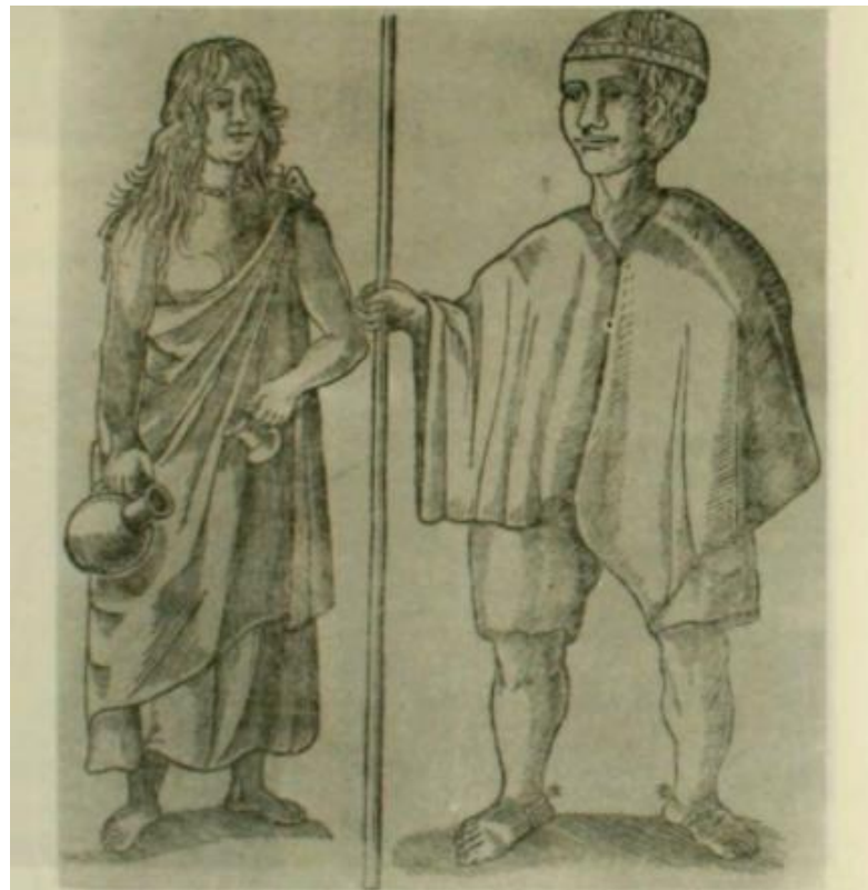
Figura 6: La más antigua representación plástica del poncho chileno (1648) citado en Historia del Arte del Reino Chileno. Eugenio Pereira Salas, 1965. viii